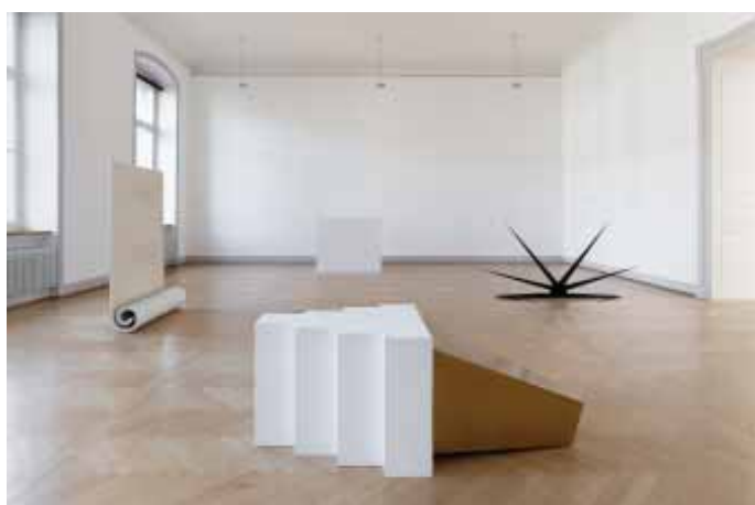
Iman Issa Installationsansicht Kunstmuseum St.Gallen