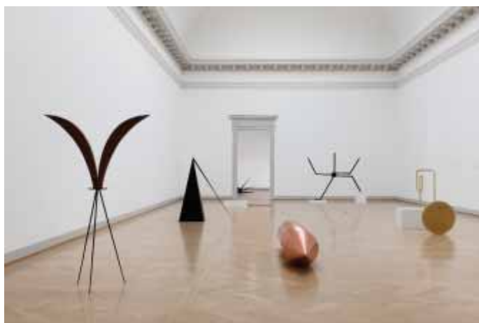
Iman Issa Installation view Kunstmuseum St.Gallen