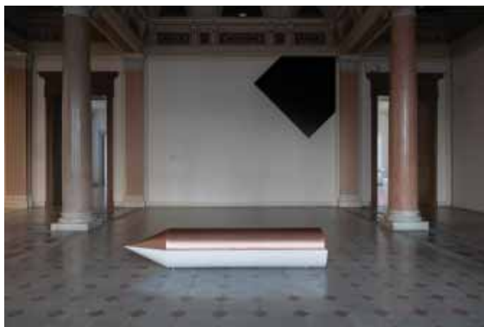
Iman Issa Heritage Studies #33, 2019, Courtesy die Künstlerin; Rodeo (London/Piraeus) und carlier/gebauer (Berlin/Madrid) Foto: Sebastian Stadler