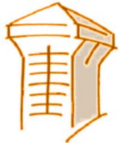
Eine Veranstaltung des Quartiervereins Lachen www.qv-lachen.ch

Anschliessend lädt der Quartierverein Lachen alle Gäste zu einem Apéro ins Restaurant Eidgenössisches Kreuz an der Zürcherstrasse 25 ein.